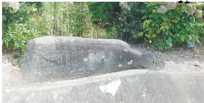
市川にある伏石。「起こしたことで疫病が流行した」「仙台藩主に遠慮して伏せた」といった話が残っています。

これまでただ通過するだけだった道でも、よく見てみるとおもしろいものや新たな発見があります。こうした魅力に気付き、知り合いや、たまたま出会った人に伝えることが道を残していくために、私に出来る第一歩なのだと感じました。