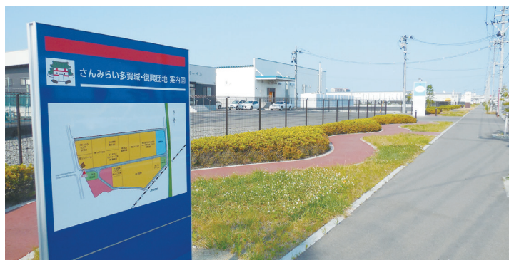
八幡のさんみらい多賀城。震災後に整備された、さまざまな企業が集まる産業エリア。見学できる工場もあります。