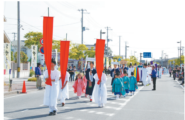
多賀城の秋を彩る万葉行列。 道は変わりますが、万葉の雰囲気はこれまでどおり。

楽しみながら多賀城のことを知ってもらい、再訪するきっかけをつくり出せるまつりだと思います。そのために、まつりの中で多賀城の歴史や魅力をうまく表現したいです。市民のみならず万葉まつりで、多賀城のことをあらためて知ってもらえたらと思います。