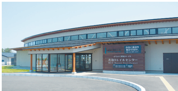
みちのく潮風トレイル名取トレイルセンター...みちのく潮風トレイル全線の管理、各地のパンフレット・トレイルを楽しむための資料・歩いた人の声といった情報発信、シャワールームや洗濯室など、トレイルに臨む人のサポートを行っています。運営はNPO法人みちのくトレイルクラブが行っています。