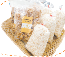
たがさぼの七夕雑貨市

▶今回も、買うことで社会貢献活動につながる、さまざまな雑貨やお菓子類が並びました。