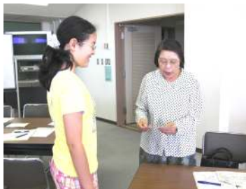
左：『アフタースクールのびのびクラブ』さん

特別史跡多賀城跡で全国からの観光客を迎えるのは、この笑顔と親切・丁寧な案内活動です。市民活動の推進+史跡案内で、新たな試み生まれそうです。