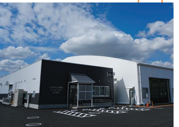
▲さんみらい多賀城イベントプラザ