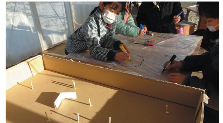
▲ダンボール工作をする子どもたち。自分のアイデアを次々に形にしています