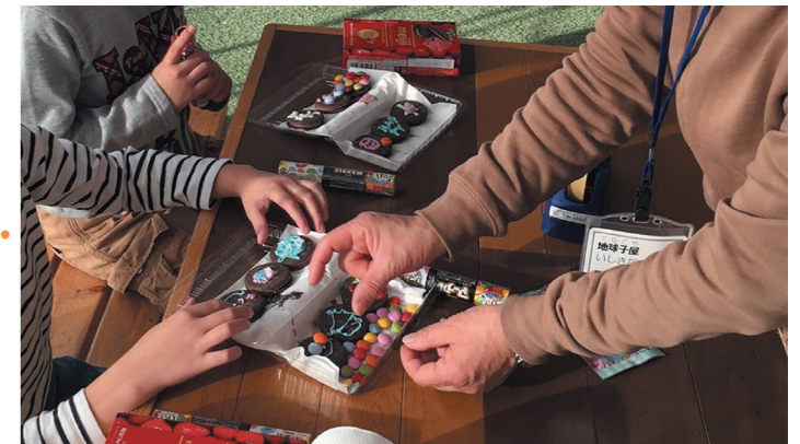
▲クッキーに装飾。完成までを見守り、時には手伝います