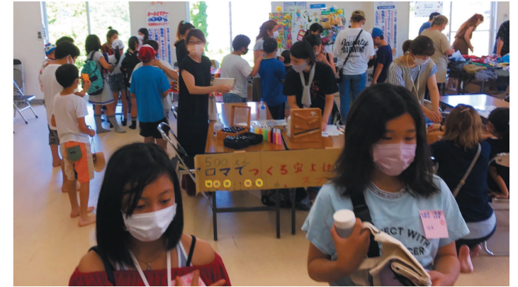
▲2021年7月に開催されたサマーフェスティバル。第1回の開催から大盛況です