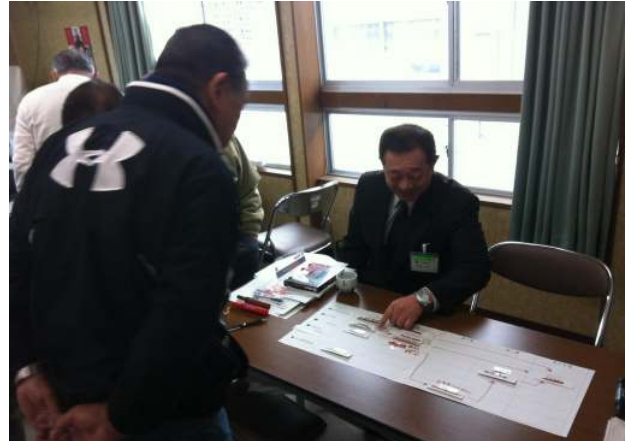
年間計画を立てるワークショップの様子

学習会では、「これからの事業、イベントを考えよう」「良い！予算計画、事業計画の作り方」などメンバーが学びたいテーマを設けています。例えば、「これからの事業、イベントを考えよう」(2月17日実施)では、大代の理想の姿や地域にある資源(人・もの・場所など)を数グループに分かれて話し合い、理想を実現するための事業、イベント案をみんなで考えました。話し合いな