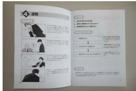
POSSEで発行している労働法のテキスト

新年度となる4月は、就職・進学に伴い、特に若者にとって生活環境に大きな変化が訪れる時期です。生活に関して支援制度の利用の仕方が分からない、職場環境や労働に関して困りごとがあるという方はぜひご利用ください。